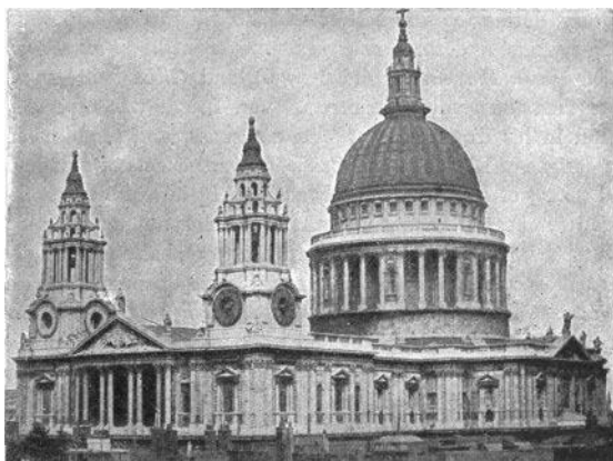
Gambar 5. Katedral St. Paul, Inggris. Gaya arsitektur Renaissance .

duniawi pada era pertengahan sangat dibatasi. Kemunculan detail ini dilandasi oleh ideologi untuk melepaskan diri dari doktrin gereja (Moffet, 2003).