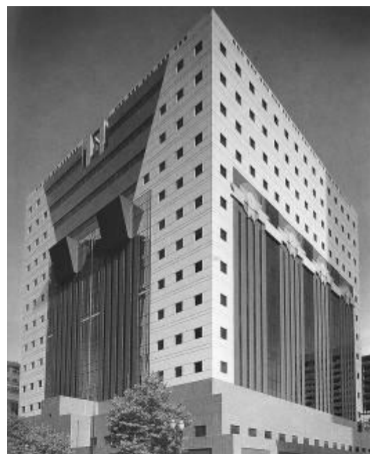
Gambar 7. Gedung Portland. Gaya arsitektur Post-Modern

Arsitektur Barat dan Timur berkembang berbeda karena pengalaman dan