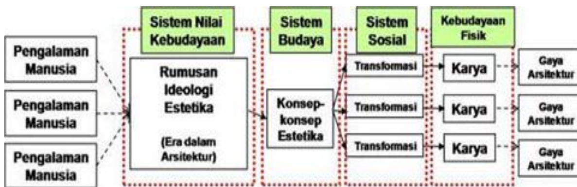
Gambar 2. Diagram Hubungan Pengalaman, Kerangka Kebudayaan dan Perkembangan Arsitektur

gagasan yang abstrak selalu dipengaruhi oleh pengalaman masing-masing individunya maupun pengalaman kolektif yang dialami kelompok masyarakat tertentu. Pengalaman ini meliputi: pengembangan kepercayaan terhadap kekuasaan dan kekuatan yang lebih tinggi; hubungan sosial dengan orang atau kelompok lain; ekspresi kepribadian individual kepada lingkungan masyarakat di sekitarnya; mengupas makna-makna yang dapat diterima oleh lingkungan (Mulder, 1975, dalam Koentjaraningrat, 2005). Manifestasi dari pengalaman ini adalah “rumusan ideologi estetika masyarakat”.