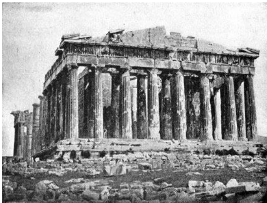
Gambar 3. Kuil Parthenon, Athena Yunani. Gaya arsitektur Yunani

Arsitektur pra-Yunani kuno sangat terkait dengan kondisi bangsa Yunani yang kaya dengan mitologi dan seni. Hal ini nampak dari fungsi dan bentuk bangunan utama sebagai bagian dari ritual pemujaan. Ideologi kebudayaan masyarakat pra-Yunani kuno tersebut menjadi dasar terbentuknya konsep nilai ke-estetika-an pada saat itu terfokus pada terciptanya bangunan-bangunan megah dan besar sebagai upaya mendekatkan manusia terhadap mitos dewa-dewi alam semesta (Fletcher, 2004).