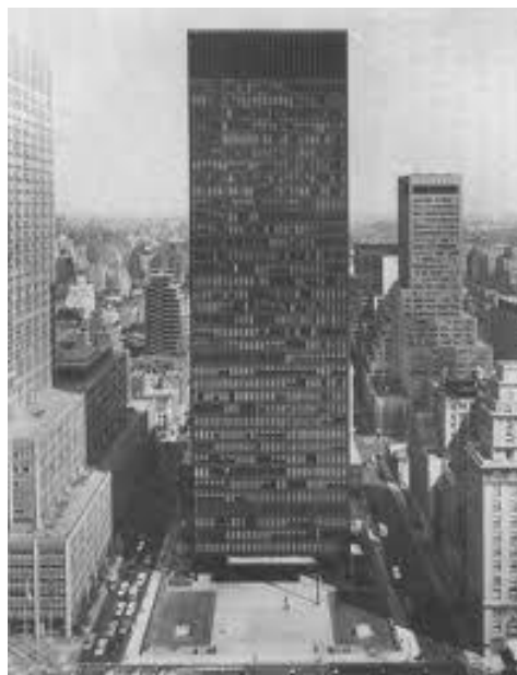
Gambar 6. Gedung Seagram, Kota New York. Gaya arsitektur Modern

makna tunggal. Pada era post-modern ini filsafat strukturalisme hingga post-strukturalisme menjadi landasan ideologis nilai-nilai budaya masyarakatnya (Ikhwanuddin, 2005).