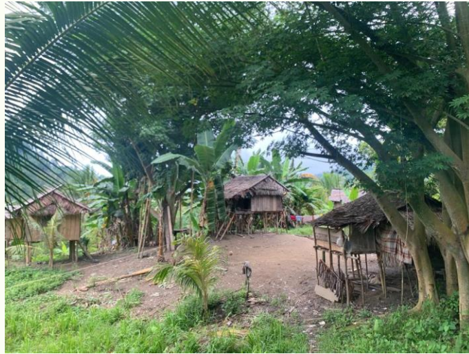
Gambar 1. Etnik Kaili Rai di Desa Taripa, Kecamatan Sindue

Kabupaten Donggala. Akses menuju ke wilayah desa/ibukota kecamatan membutuhkan waktu kurang lebih dua jam dari Kota Palu. Selanjutnya berjalan kaki menelusuri sungai maupun bukit selama kurang lebih tiga jam untuk dapat tiba di lokasi permukiman mereka, melalui jalan setapak (belum dapat diakses dengan kendaraan) sebagai komponen lingkungan permukiman. Permukiman setempat terdiri atas tiga kelompok (cluster) yang merepresentasikan rumpun keluarga (klen) setiap kelompok. Unit-unit rumah tinggal berbentuk rumah panggung terbuat tiang kayu, dinding dan lantai papan serta bahan atap dari bahan rumbia. Material bambu dimanfaatkan sebagai bahan pembuat tangga dan sebagian tiang utama unit-unit rumah, yang mana keseluruhan material bangunan diperoleh dari lingkungan dan alam mereka bermukim.