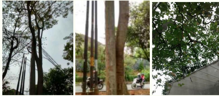
Gambar 3. Pohon di Tengah Infrastruktur Perkotaan

Pohon pada lokasi tepi jalan menunjukkan intensitas target yang lebih tinggi dibanding pohon pada area terbuka. Analisis faktor tapak memperlihatkan bahwa sebagian besar pohon mengalami tekanan ruang tumbuh, terutama pada P3, P4, P5, P6, dan P7 yang berada di tepi jalan (gambar 4). Kondisi tanah relatif sempit, dipadatkan, dan pada beberapa kasus tertutup perkerasan hingga 80%. Perubahan tapak berupa pemotongan akar ditemukan pada hampir semua pohon tepi jalan. Seluruh pengamatan dilakukan pada kondisi iklim mikro yang sama, yaitu hujan berat, yang turut memengaruhi kelembapan tanah dan potensi kegagalan perakaran.