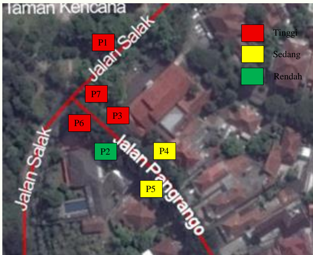
Gambar 5. Pemetaan Lokasi Pohon Berisiko

Distribusi risiko pada koridor Jalan Salak dan Jalan Pangrango menunjukkan bahwa pohon berisiko tinggi terkonsentrasi pada segmen dengan trotoar sempit dan perkerasan yang sangat dekat dengan batang, terutama pada area persimpangan kedua jalan tersebut. Kondisi ini menyebabkan zona perakaran menjadi sangat terbatas, akar terpotong, dan sebagian tertutup perkerasan hingga 80%, sehingga kemampuan pohon untuk menopang beban struktural berkurang secara signifikan. Sebaliknya, pohon yang berada pada area terbuka dengan ruang perakaran lebih luas (P1–P2) menunjukkan tingkat risiko rendah karena tidak mengalami tekanan fisik dari infrastruktur dan memiliki ruang tumbuh yang cukup. Korelasi ini memperlihatkan bahwa keterbatasan ruang tanam dan perubahan tapak—terutama pemotongan akar akibat pembangunan trotoar dan utilitas—merupakan faktor dominan yang meningkatkan risiko kegagalan pohon pada jalur hijau perkotaan.