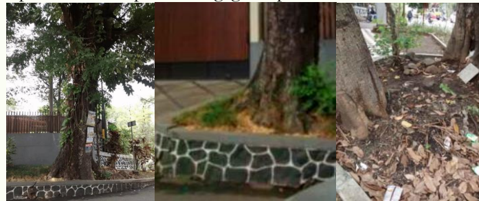
Gambar 4. Pohon Memiliki Tekanan Ruang untuk Tumbuh

Pohon pada lokasi tepi jalan menunjukkan intensitas target yang lebih tinggi dibanding pohon pada area terbuka. Analisis faktor tapak memperlihatkan bahwa sebagian besar pohon mengalami tekanan ruang tumbuh, terutama pada P3, P4, P5, P6, dan P7 yang berada di tepi jalan (gambar 4). Kondisi tanah relatif sempit, dipadatkan, dan pada beberapa kasus tertutup perkerasan hingga 80%. Perubahan tapak berupa pemotongan akar ditemukan pada hampir semua pohon tepi jalan. Seluruh pengamatan dilakukan pada kondisi iklim mikro yang sama, yaitu hujan berat, yang turut memengaruhi kelembapan tanah dan potensi kegagalan perakaran.