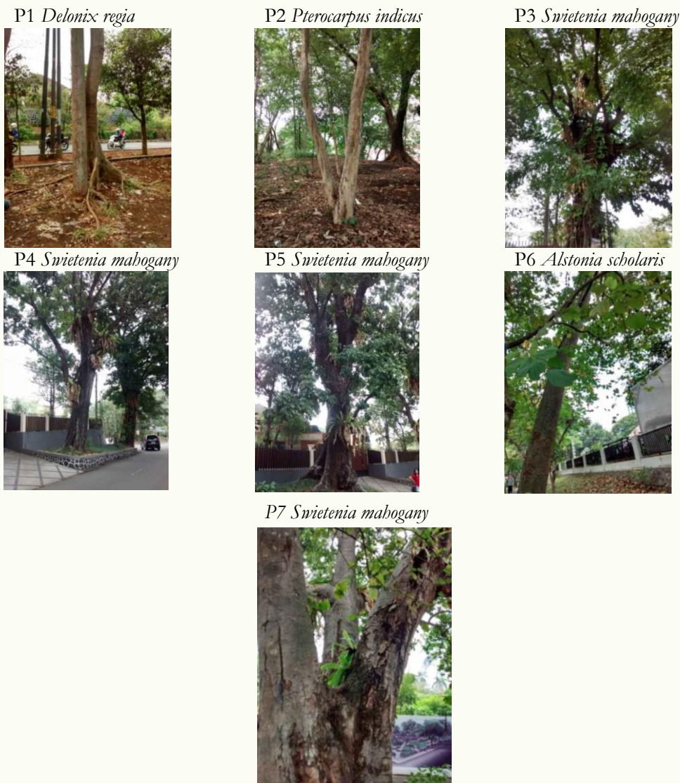
Gambar 2. Sampel Pohon di Lokasi Pengamatan

Hasil penilaian target menunjukkan bahwa hampir seluruh pohon berada dalam kedekatan langsung dengan aktivitas manusia dan infrastruktur penting, seperti jalan raya, tiang listrik, gedung pertokoan, dan area pejalan kaki (gambar 3). Mayoritas target berada “dalam zona tajuk”, dengan durasi keberadaan yang konstan hingga sering. Hal ini meningkatkan tingkat eksposur risiko apabila terjadi kegagalan pohon.