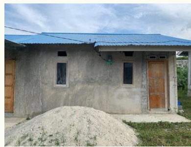
Gambar. 8. Huntap yang mengalami kerusakan