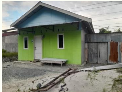
Gambar. 7. Rumah yang dibangun kembali pada kawasan lindung