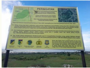
Gambar. 5. Papan peringatan yang ada di kawasan lindung