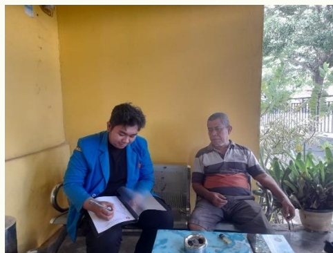
Gambar. 4. Wawancara dengan Bapak RT Kelurahan Balaroa

Harapan Bapak RT adalah agar masyarakat dapat memahami pentingnya kawasan lindung tidak hanya untuk kepentingan mereka saat ini, tetapi juga untuk keberlanjutan lingkungan dan keselamatan generasi mendatang. Kesimpulannya, perlu ada upaya lebih lanjut untuk mendidik dan melibatkan masyarakat dalam menjaga kawasan lindung agar kesadaran dan tanggung jawab terhadap lingkungan dapat terbangun.