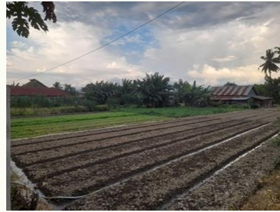
Gambar. 6. Lahan kawasan lindung yang dimanfaatkan untuk ekonomi masyarakat